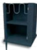
Druckerunterschrank optional erhältlich